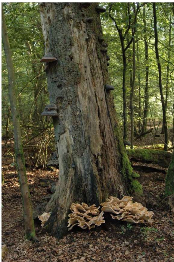
Riesenporling ( Meripilus giganteus )